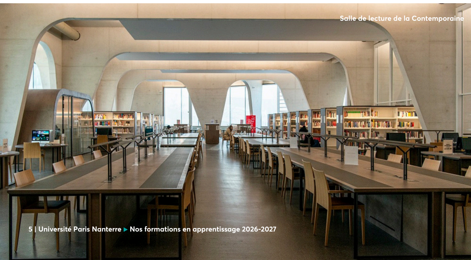
Salle de lecture de la Contemporaine

Université pluridisciplinaire, l'Université Paris Nanterre propose une offre de formation et de recherche couvrant un large éventail : sciences humaines et sociales, lettres, langues, droit, économie, gestion, technologie, arts, communication, sciences pour l'ingénieur et sciences et techniques des activités physiques et sportives. Dans chacun de ces domaines, l'établissement défend l'innovation pédagogique et scientifique tout en assumant un rôle social majeur. Depuis sa création, l'Université s'engage pour la promotion de ses étudiantes et étudiants, tout en cultivant un regard critique et constructif sur les évolutions de la société. Elle veille ainsi à produire et transmettre des savoirs qui préparent chacun à un avenir choisi et éclairé, au service de l'intérêt général.